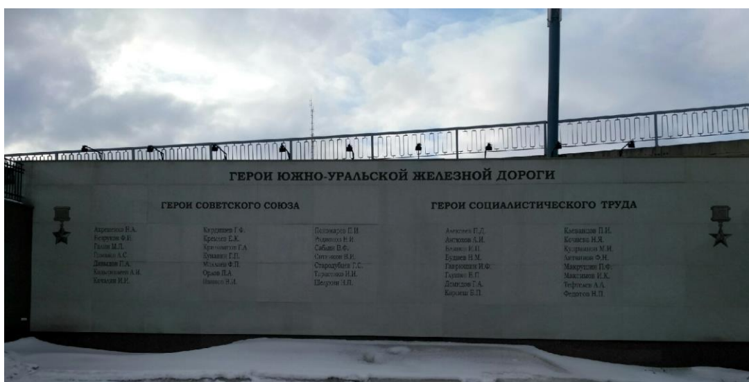
Железнодорожный вокзал города Челябинск

9. Где расположена мемориальная стена, на которой увековечена память Героя Советского Союза - магнитогорца Тарасенко И.И.?