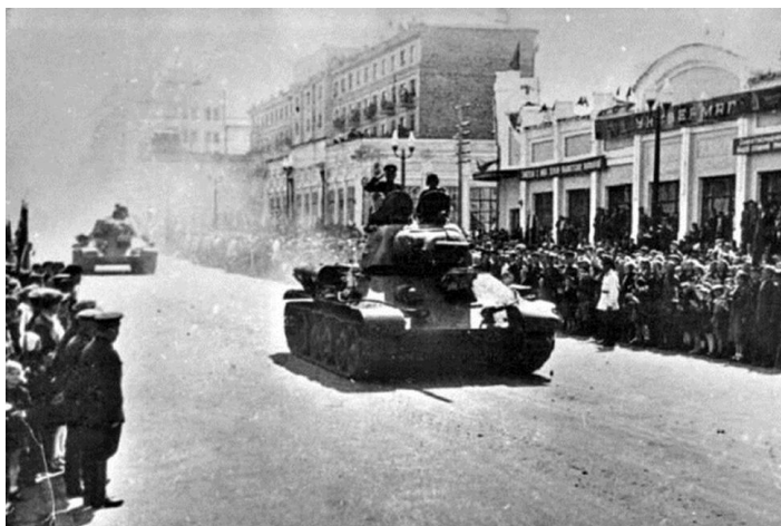
Проводы танкистов были организованы на центральной улице города Челябинска

С этого времени началось формирование корпуса. Приказом Народного комиссара обороны от 11 марта ему присвоено наименование - 30-й Уральский добровольческий танковый корпус. Более 100 тыс. заявлений подали рабочие заводов. На одно место воина корпуса претендовало 12 человек. Были созданы комиссии на предприятиях и в военкоматах. Они отбирали физически крепких, здоровых людей, умеющих управлять техникой и тех, чьи специальности применимы в танковых войсках. Танковый корпус был собран в короткие сроки, его торжественные проводы состоялись 9 мая. Было подано 115000 заявлений, отобрано 9660 добровольцев, отбор в дивизию был жесточайшим, брали только самых лучших бойцов. В период формирования Уральского добровольческого танкового корпуса в 1943 году каждый боец и командир получил в качестве подарка от Златоустовских оружейников «черный нож». На эту особенность в экипировке уральских танкистов сразу обратила внимание немецкая разведка, давшая корпусу свое название – «Шварцмессер панцерн дивизион» - танковая дивизия «Черный нож».