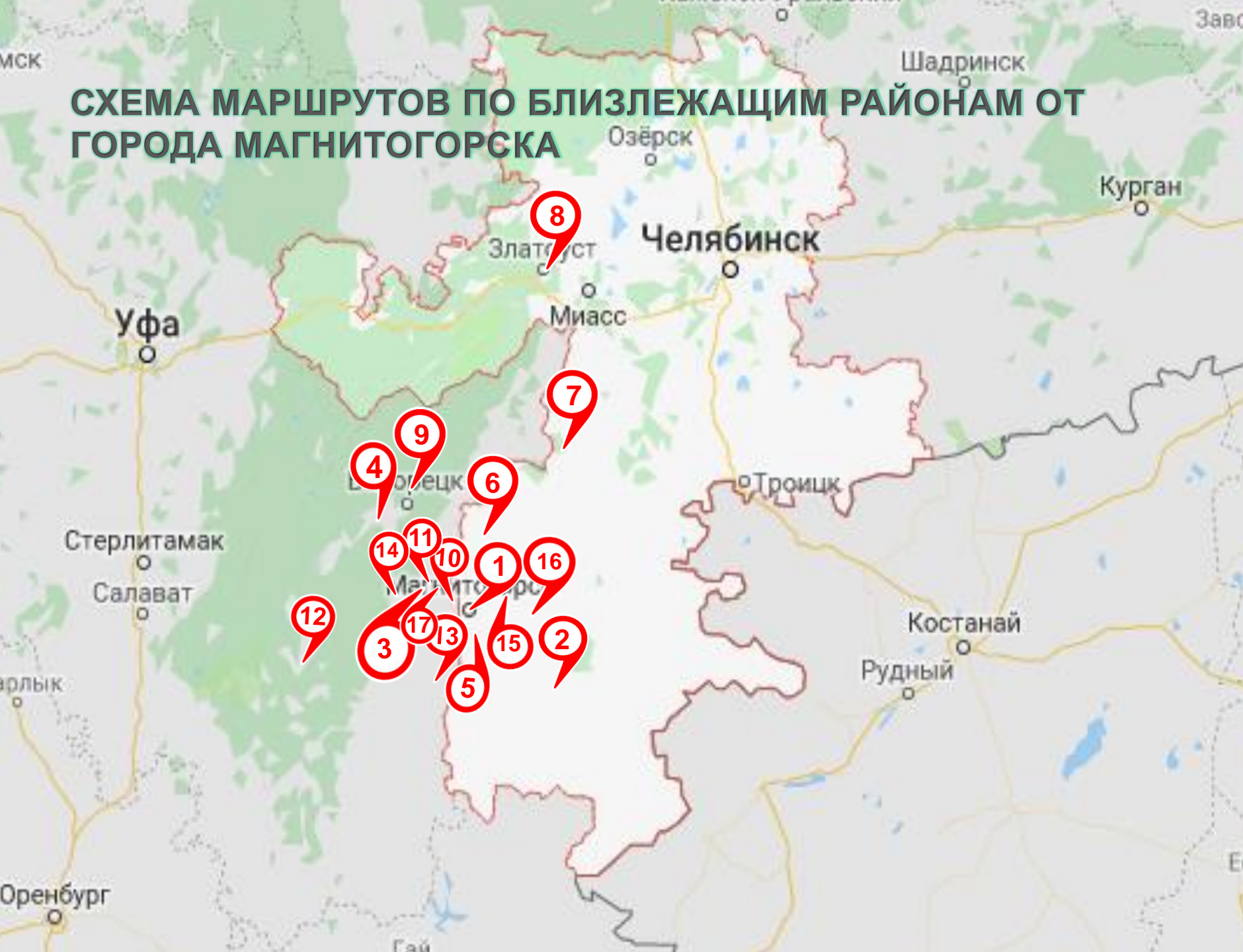
СХЕМА МАРШРУТОВ ПО БЛИЗЛЕЖАЩИМ РАЙОНАМ ОТ ГОРОДА МАГНИТОГОРСКА